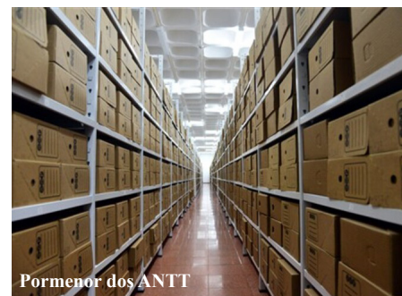
Pormenor dos ANTT

Cabe ao ANTT salvaguardar, valorizar e divulgar esses documentos. Como é que isso tem sido feito?