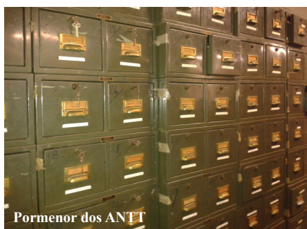
Pormenor dos ANTT

A pesquisa no ANTT pode ser feita presencialmente ou através da internet em https://antt.dglab.gov.pt/pesquisar-na-torre-do-tombo/fundos-e-coleccoos/