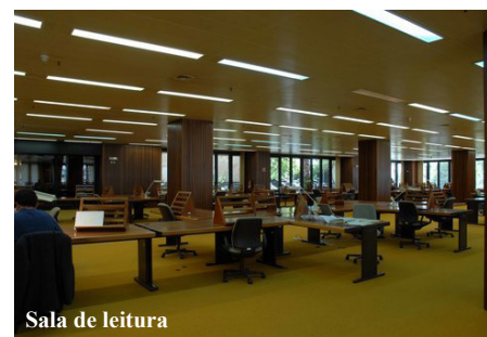
Sala de leitura