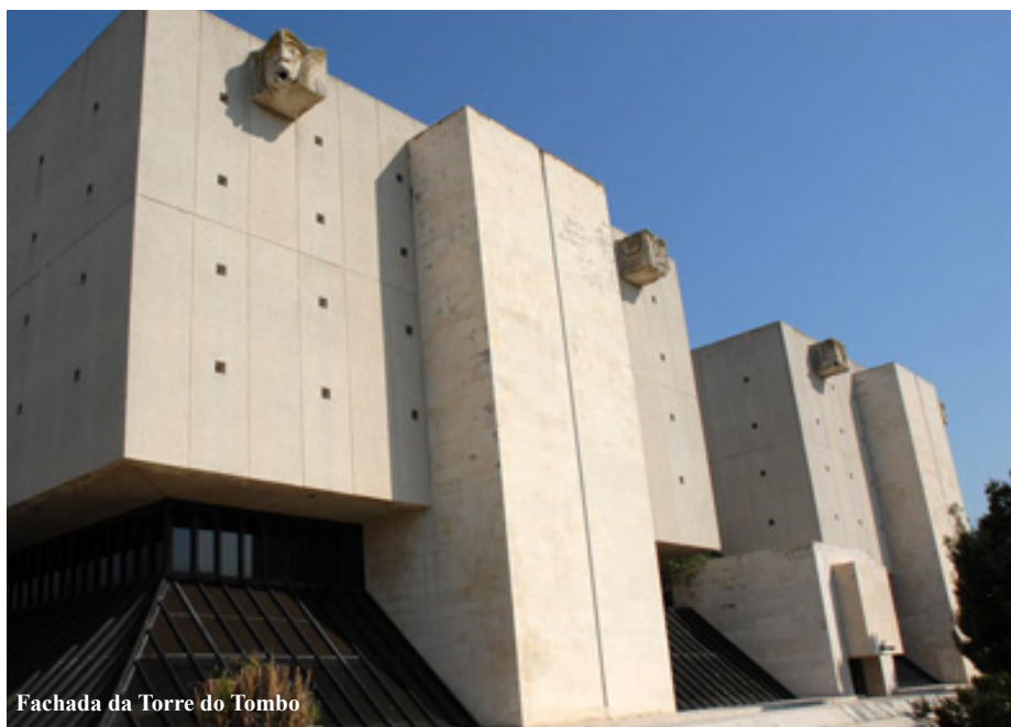
Fachada da Torre do Tombo