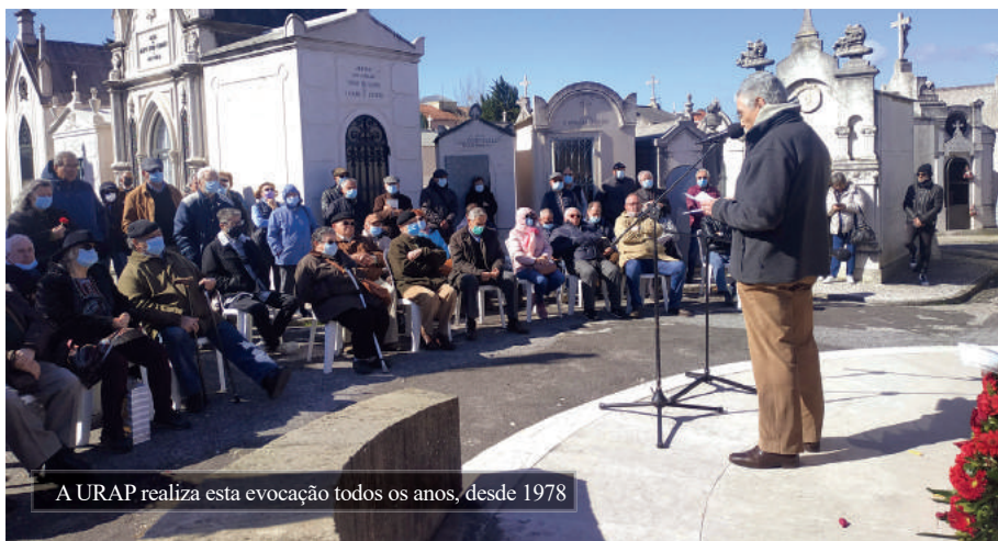
A URAP realiza esta evocação todos os anos, desde 1978

A URAP prestou homenagem, dia 19 de Fevereiro, aos antifascistas mortos no Campo de Concentração do Tarrafal, em