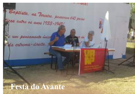
Festa do Avante

A URAP prossegue, um pouco por todo o País, a divulgação da sua actividade editorial, destacando-se neste período o último livro, « Os Presos e as Prisões Políticas em Angra do Heroísmo », e ainda o anterior, dedicado às mulheres, « Elas Estiveram nas Prisões do Fascismo ». As sessões são acompanhadas, na maior parte dos casos, por um momento musical.