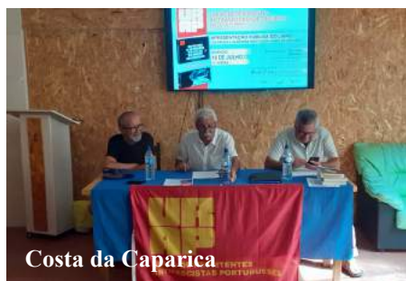
Costa da Caparica