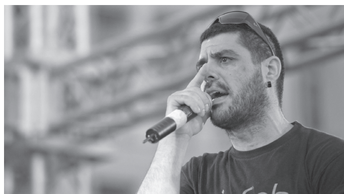
O cantor grego Pavlos Fissas foi assassinado por grupos neonazis pela sua firme postura antifascista

A luta antifascista assume-se assim como uma das frentes de combate mais relevantes do contexto político, económico, social e cultural grego. Uma luta que não se desliga de outras igualmente relevantes, numa interdependência que me parece evidente: a luta pela retoma da soberania grega, contra a dominação das troikas, contra o «memorando» grego, contra a União Europeia, pela paz e contra a guerra na região, a luta pelos salários, pelos direitos e pela democracia.