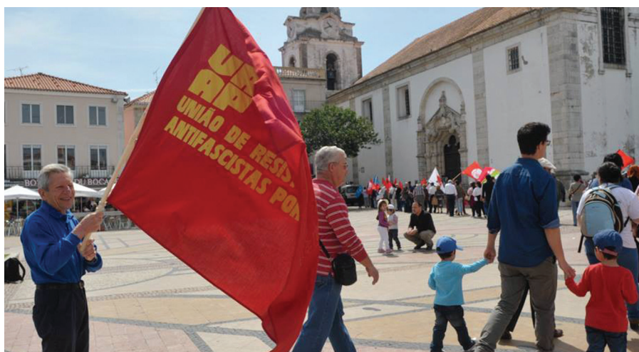
Em Setúbal, várias associações e movimentos, incluindo a URAP, evocaram a vitória com um cordão humano que percorreu o centro da cidade