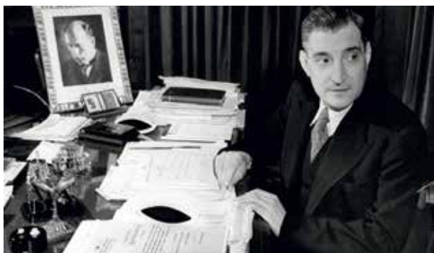
Salazar fez-se fotografar com a imagem do ditador fascista italiano Benito Mussolini