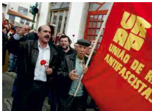
Já em 2007 a mobilização dos democratas e antifascistas travou a intenção de construção do “museu Salazar”