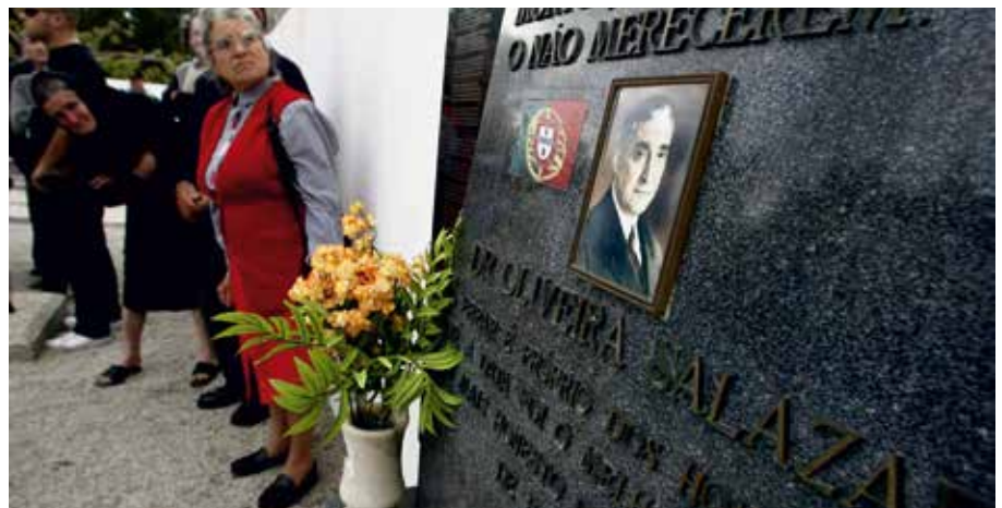
A URAP considera que o chamado “museu Salazar” se tornaria num lugar de culto para saudosistas da ditadura